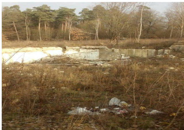
Фото. 1. Об'єкт підвищеного екологічного ризику поблизу Молчанова

Таким чином, обидва названих села та їхні околиці являють собою надзвичайно цікаві об'єкти для планування екскурсій і краєзнавчих маршрутів. Разом з тим, в районі залишаються нерозв'язаними складні проблеми екологічного стану місцевості, які стримують розвиток туризму на місцевих теренах. Найбільшою проблемою для всього Локачинського району є наявність газового родовища, звідки отруйні виділення поширюються на велику відстань, забруднюючи повітря і воду. Отруйні виділення негативно впливають на стан здоров'я людей, викликаючи загострення захворювань дихальних шляхів. Ці загострення особливо посилюються у вітряну погоду. Місцеві селяни стверджують, що трапляються дні, коли від газового смороду неможливо сховатися навіть у будинку. Адже локачинський газ містить сполуки сірки, які за технологією очищують і спалюють. Однак, недосконалість очищення газу проявляється в ризиках отруєння людей.