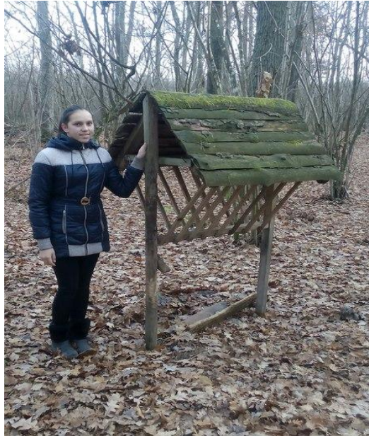
Фото 2. Гарно у наших лісах навіть глибокої осені (авторка тексту Тлушкевич Н.)

вирубку лісових насаджень, відсутність контролю за станом природних ресурсів, діяльністю державних і приватних господарств. Нами разом із учнями місцевих сільських шкіл неодноразово з року в рік організовувались прибирання сміття, яке накопичується навколо сіл і, найбільше, вздовж берегів водойм. Однак, подібні дії без відповідного нормативного та організаційного регулювання місцевої системи господарювання не здатні забезпечити зменшення екологічних ризиків на території району [1, 2].